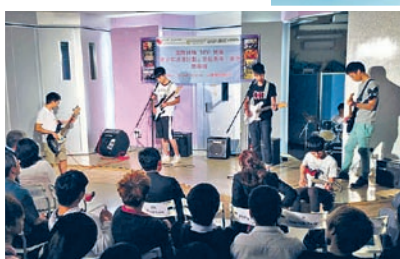
▲ 「高毅青年·夢想」項目計劃招收14至21歲的高危青少年，圖為面試情況。

部分青少年會有濫藥及打架等高危行為，如能引導他們主動規劃生活及事業，並發展興趣及擴闊視野，有助他們減少該些行為。有見及此，救世軍柴灣青少年綜合服務推行「高毅青年·夢想」項目計劃，從興趣發展津貼、技能提升津貼、試工津貼、行業分享及工作坊4方面，協助青少年提升「M.O.R.E.」的要素。目前項目已成功招收約20名柴灣區14至21歲的高危青少年，部分已參加興趣課程如搖滾樂及爵士舞等；而扶輪社亦安排工作坊，激發青少年的毅力和信心。