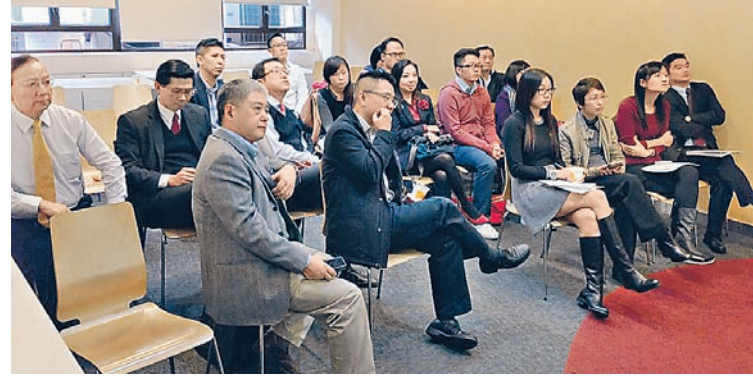
入圍計劃的機構代表出席經驗分享會，並與扶輪社成員進一步討論計劃的細節。

示，計劃得以進行，實有賴多個社會服務機構和一眾來自不同專業領域的扶輪社員的支持和參與，相信他們能夠成為年青人的嚮導和榜樣，藉言傳身教推動年青人努力向上流動；他更期望，計劃能擴闊年青人的視野，提升他們日後的就業機會。勞工及福利局局長張建宗在致詞中讚揚扶輪社與社聯這個策略性合作模式極具前瞻性及有啟導作用，局方會參考作為日後有關工作的楷模。