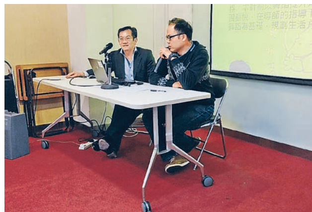
早前，各個社會服務機構分享了參與計劃所評估的成效指標，並描述扶輪社成員如何參與該計劃。

徑，從而擴闊個人視野；另外，要在社會向上流，年青人需要強化社會網絡，包括朋輩和榜樣，分享快樂、希望、願望及恐懼，並在過程中認識自我，掌握個人需要和潛能，重整個人目標以至規劃自己的職業生涯。